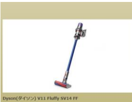
Dyson(ダイソン) V11 Fluffy SV14 FF