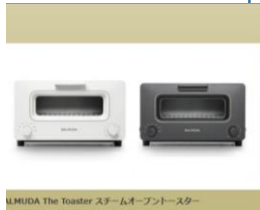
Midea The Toaster スチームオープントースター