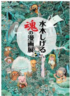
2019年7月28日(日)～9月23日(月・祝)

皆様一度は見たことはある、「ゲゲゲの鬼太郎」！ 現在は第6シリーズが放映中です。 初回放送が1968年ですので、日本を代表するアニメのひとつでございます！ そんなアニメの原作者であります、水木しげる先生の 展覧会が現在宇都宮市で開催中です☆ 繊細なタッチで描かれたさまざまな妖怪も可愛いです、 周りの風景も緻密で、先生の凄さを実感できます！ 残暑も厳しい9月は、涼しい美術館内でゆったり過ごしてみるのがいいかもしれませんか♪