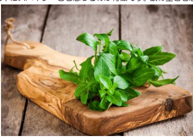
※「メディカルグレード」の精油をお使いください。

日中は暑さを感じる日も増え、季節が一段階進んだような感覚が出てきました。気温の上昇に体が追いつかず、だるさや集中力の波を感じやすい時期でもあります。このタイミングは、無理に頑張るよりも、こまめにリズムを整える意識が大切です。そんな時に取り入れやすいのが、軽さと適度な刺激を併せ持つ香りです。今回おおすすめするのはバジル。バスタなどで馴染みのあるハーブですが、精油になると甘さは控えて、すっきりとした中にスパイスさを感じるのが特徴です。頭の重さを感じている時や、思考を切り替えたい場面で使いやすい、集中しづらい時に気持ちをすっきり整える働きもあります。使い方は、マグカップにお湯を注ぎ1滴垂らすだけ。強く香らせる必要はなく、空気が少し変わる程度で十分です。気温が上がるとこの時期、香りをうまく使いながら日々のコンディションを整えてみてはいかがでしょうか。