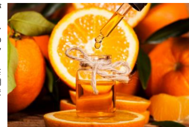
※「メディカルグレード」の精油をお使いください。

日に日に寒さが増すように感じるこの季節。体も心も少し縮こまりやすくなります。・・さて、そんな時期におすすめなのが、明るくやさしい香りが特徴の「スイートオレンジ」の精油です。果実をむいた瞬間のような甘くフレッシュな香りは、気分転換にぴったり。アロマに慣れていない方も使いやすい、誰にでも好かれやすい親しみのある香りです。 使い方はとても簡単。マグカップにお湯を入れ、スイートオレンジを1〜2滴落とすだけで、ほのかな香りが広がります。仕事の合間のリセットや、在宅勤務の気分づくりにもおすすめです。また、乾燥が気になるこの時期は、加湿器のアロマ対応トレイに入れるとお部屋全体が明るく爽やかな雰囲気になります。 ちなみに、アロマで「オレンジ」と書かれているものの多くは、このスイートオレンジのこと。 甘く穏やかな香りは、寒さで気持ちが沈みがちな時期をそっと後押ししてくれます。