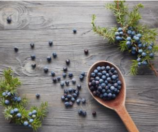
※「メディカルグレード」の精油をお使いください。