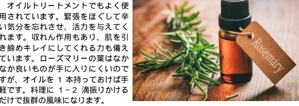
※「メディカルグレード」の精油をお使いください。

今回は「ローズマリー」です! 常緑の低木で、ハーバルな良い香りを持つローズマリーの葉。豚肉、チキンなどの肉料理や魚料理にもよく使われていますよね。ローズマリーは最も古い歴史をもつハーブの一つで、古代より記憶力、集中力を高める強壮薬として活用されてきました。勉強や仕事など記憶力や集中力を高めたいときは、お部屋にティフューズしたり、ハンカチに1滴たらして置いておくのと良いでしょう。また、現代の研究では、認知症の予防にも効果があることが分かっており、実際に介護の現場などでも使われています。